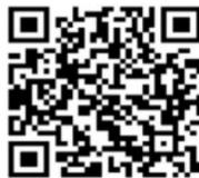
企业微信 APP 下载二维码

扫描下方二维码或在手机的应用商店中搜索“企业微信”，完成企业微信 APP 的安装，使用激活统一身份认证时验证后的手机号登录企业微信登录即可。